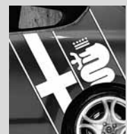
Alfa Romeo Logo auf der Seite