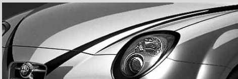
V über der Motorhaube