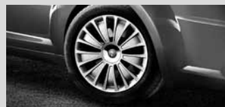
16"-Stahlräder mit Radvollabd. Eco