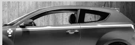
Quadrifoglio Verde Logo und Streifen auf der Seite