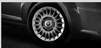
15"-Stahlräder mit Radvollabdeckung