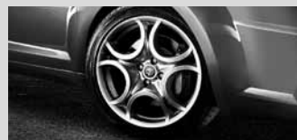
17"-Leichtmetallräder „Sport I“