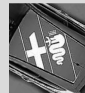
Alfa Romeo Logo auf dem Dach