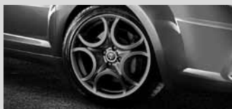
17"-Leichtmetallräder „Sport I“ (Titan)