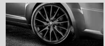
18"-Leichtmetallräder „Quadr. Verde“

Kraftstoffverbrauch und CO 2 -Emissionen siehe Seite 3 und Seite 15.