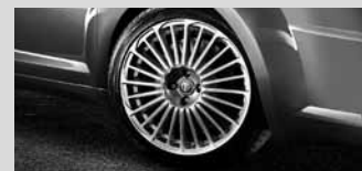
17"-Leichtmetallräder „Elegante I“